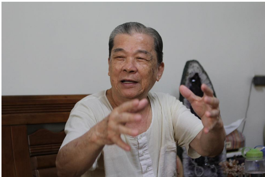
圖七：保存運動志工訪談彰化臺鐵舊宿舍群原住戶。

2014年5月初，半線新生會與其他參與的公民團體、文史工作者以及保存運動志工受縣府要求，進入協商程序；在協商會議中，參與人員不斷提出應延長調查研究時間，再討論保留建物的建議名單，然縣府以時間無法等待為理由，逕自決議僅保留18棟建物。在彰化縣政府強勢的主導下，半線新生會與其他參與人員為避免該區全區建築遭到不可回復性的破壞，而接受縣府之決議。其他參與保存運動的成員，認為此項決議結果與原先想像有很大的落差，並希望透過申請文化資產，阻擋都市更新的推進。同年6月16日，彰化縣文化局召開文化資產審議委員會，決議彰化臺鐵舊宿舍群全區列冊追蹤，暫緩拆除，並建議彰化縣政府組成專案小組，討論宿舍群後續的保存問題。