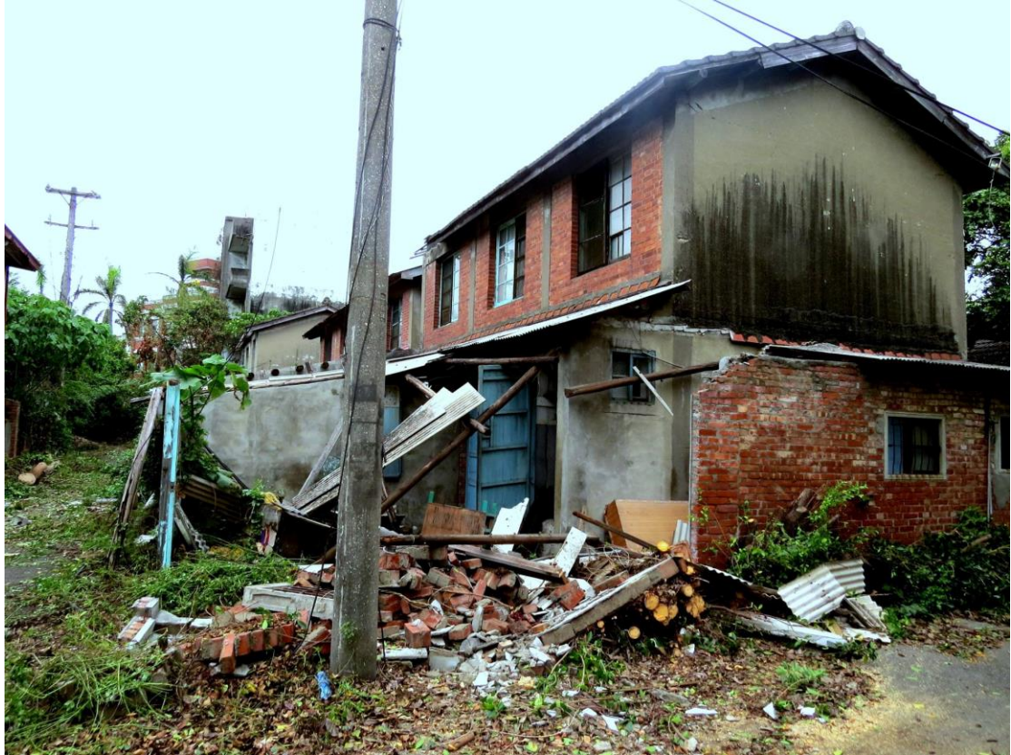
圖十六：彰化臺鐵舊宿舍群建物頹傾現狀。