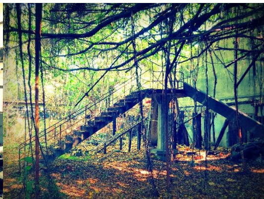
圖四：鐵福幼稚園教室。資料來源：吳俊成。圖五：鐵福幼稚園溜滑梯。資料來源：吳俊成。