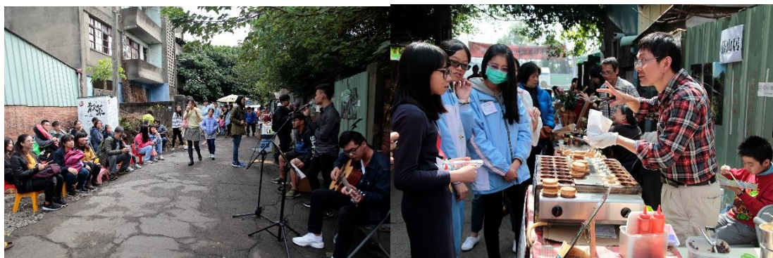
圖十二：音樂展演。圖十三：在地市集。

動，吸引群眾關注、參與彰化臺鐵舊宿舍群保存運動，觸發彼此對話溝通的空間，激盪出更多元的議題觀點，並藉機培訓參與保存運動的志工群。