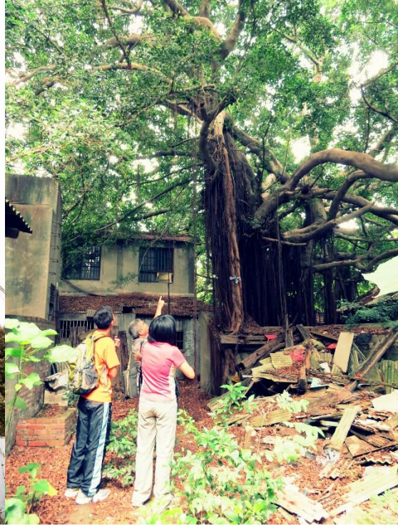
圖二：四層樓職員眷屬宿舍。資料來源：吳俊成。圖三：聚落內珍貴老樹。資料來源：吳俊成。

除了上述鐵路員工的居住空間外，聚落內亦設置幼稚園、福利社、游泳池、網球場、撞球室、理髮廳、員工浴室等公共空間與福利設施，連同宿舍區內的植栽、防空洞，構成完整的鐵路員工生活聚落（吳俊成編，2018；李佳龍主持，2017）。