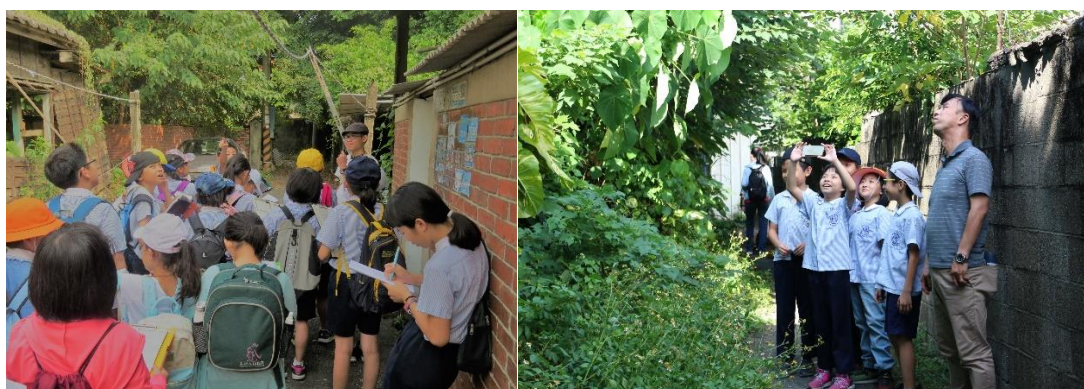
圖十四：歷史走讀。圖十五：生態觀察。